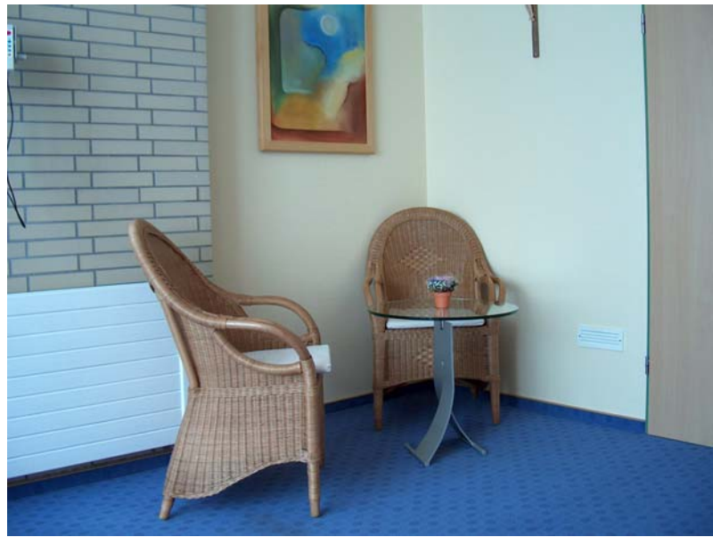
Spes viva – Zimmer innere Abteilung I. Stock

Spes Viva – in lebendiger Hoffnung. Dies ist für mich und meine Kolleginnen und Kollegen auf Station ein Leitwort geworden, das wir versuchen, täglich in unserer Arbeit umzusetzen. Trotz oft andauernder Überbelastung bei einer Bettenbelegung von 130 % bemühen wir uns, den Spes viva – Gedanken umzusetzen. Wir als Team sind froh und dankbar darüber, dass die Krankenhausleitung sich dazu bereit erklärt hat, das Projekt Spes viva im Krankenhaus Sankt Marienwörth einzuführen. Ich hoffe, dass anhand meiner Schilderungen etwas von den positiven Erfahrungen zu vermitteln war. Wir stehen noch am Beginn von Spes viva in unserem Krankenhaus und es ist noch viel Arbeit notwendig, aber die ersten Schritte sind getan und die Ergebnisse sind durchweg positiv.