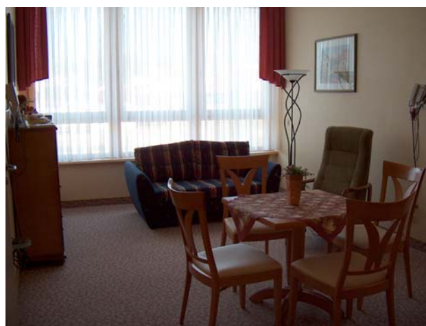
Das Spes Viva Zimmer im Blickwinkel von der Eingangstür

Kommodenschrank, einem CD- Player und einer Küchenzeile eingerichtet. Ebenso verfügt dieses Zimmer über eine separate Toilette für die Angehörigen. Diese Einheit liegt in der Nähe des Stationszimmers und Personalaufenthaltsraumes, so dass es schnell erreichbar ist.