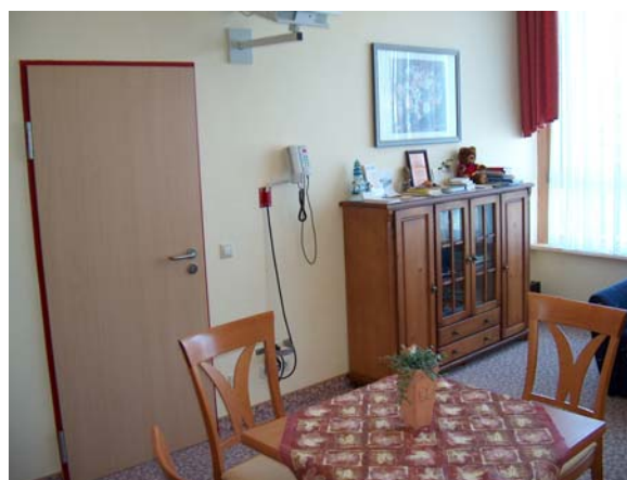
Spes Viva Zimmer der Onkologie

Auch bei uns im Krankenhaus Sankt Marienwörth besteht die Spes viva Einheit aus einem Wohnzimmer, das zwischen zwei Krankenzimmern liegt, diese sind durch Verbindungstüren zu erreichen. Unser Wohnzimmer ist mit einer Couch, einem Sessel, einer Tischgruppe mit vier Stühlen, einem kleinen