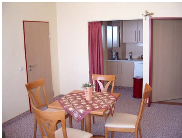
Spes Viva Zimmer der Onkologie mit Blick in die Küchenzeile

( Verbindungstür zum angrenzenden Patientenzimmer )